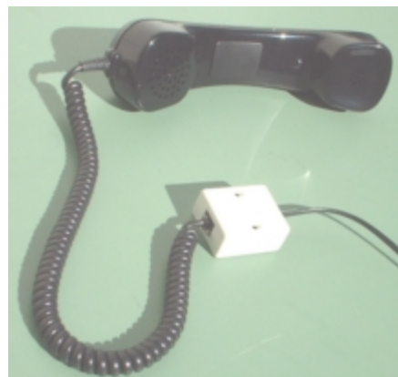
Example of operation